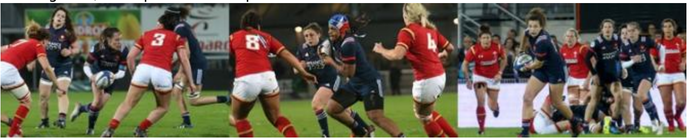
Equipe de France féminine de rugby.