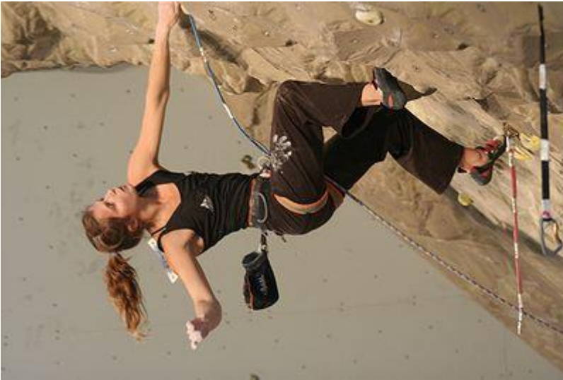
Charlotte Durif, championne du monde espoir de difficulté (escalade) en 2004, 2005, 2006, 2007, 2009