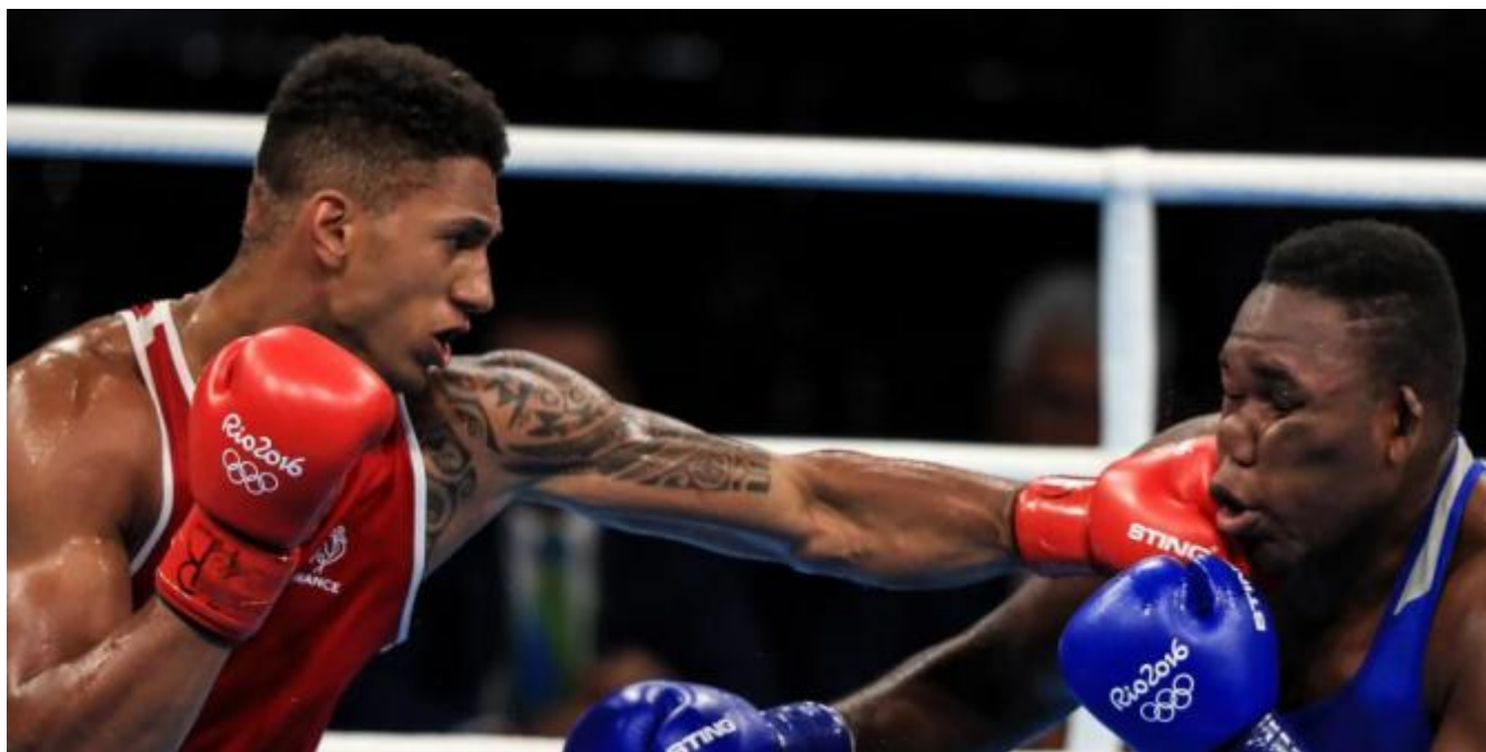
Tony Yoka, médaille d'or aux JO de Rio, 2016