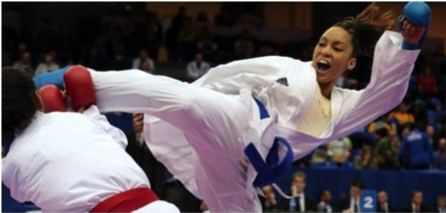
Lucie Ignace, championne d'Europe de karaté en 2009 et 2015 .