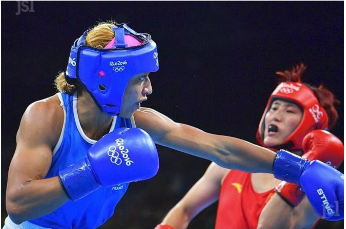
Estelle Mossely, médaille d'or aux JO de Rio, 2016