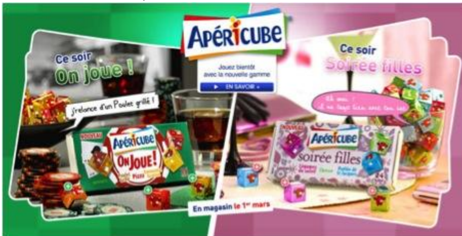
Apéricubes pour garçons et pour filles.

Dessiner sous une forme schématique la place occupée par les filles et les garçons dans la