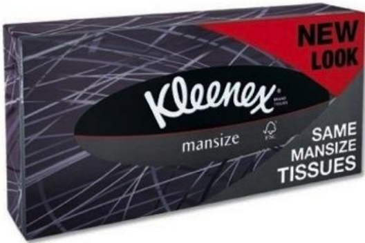
Mouchoirs pour hommes donc "plus grands".