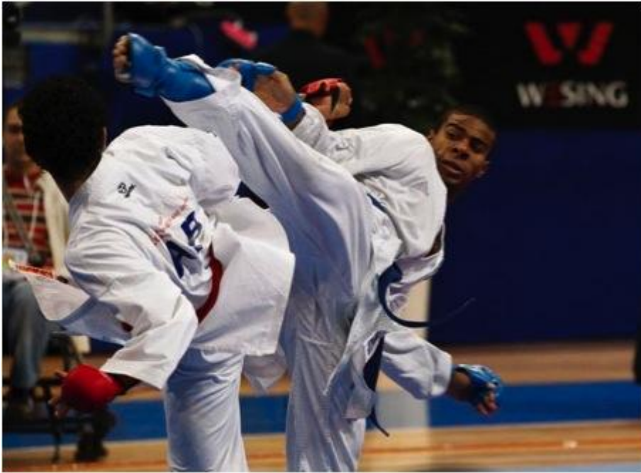
Kenji Grillon, champion du Monde individuel de karaté combat et par équipe à Paris en 2012 et 2013