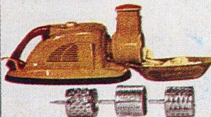
Râpe, coupe, tranche légumes et fromages.