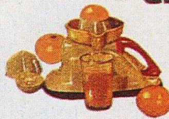
Presse-fruits : oranges, citrons, pamplemousses.