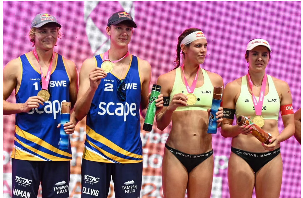
Championnat du Monde Beach Volley, 2025

Et pourquoi des tenues différentes alors qu'ils/elles pratiquent le même sport ?