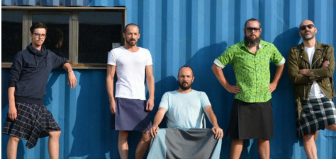
Image d'un site de vente de vêtements en ligne. Des hommes aiment les jupes. Et les portent.