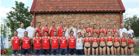
Equipes masculine et féminine norvégiennes de beach hand ball 2021 : comparer les tenues : à votre avis pourquoi une telle différence ?