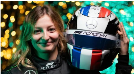
F1, moto, cross, rallye... les championnes comme Doriane Pin sont de plus en plus nombreuses.