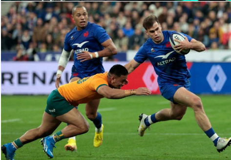
En haut : équipe de France de Rugby (masculine) En bas : équipe de France de Rugby (féminine) C'est bien le même sport.