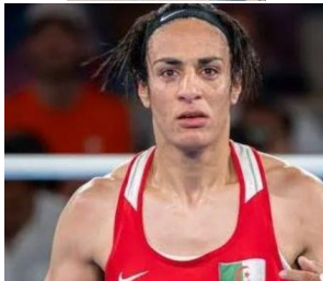
Imane Khelif, boxeuse, JO de Paris (2024) : les hateurs de tous poils (réactionnaires, homophobes, transphobes, intégristes, etc) s'en sont donné à coeur joie ; les réseaux (et parfois la presse) se sont fait l'écho de leurs discours discriminants et violents ; elle ne pourrait pas être une femme car elle ne ressemble pas à une femme ?????