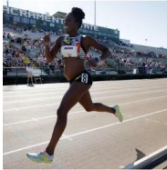
Enceinte et sportive de haut niveau ? C'est possible ! (n'en déplaisent à certain.es).