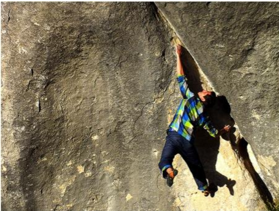
Romain Desgranges, champion d'Europe en difficulté (escalade) en 2013