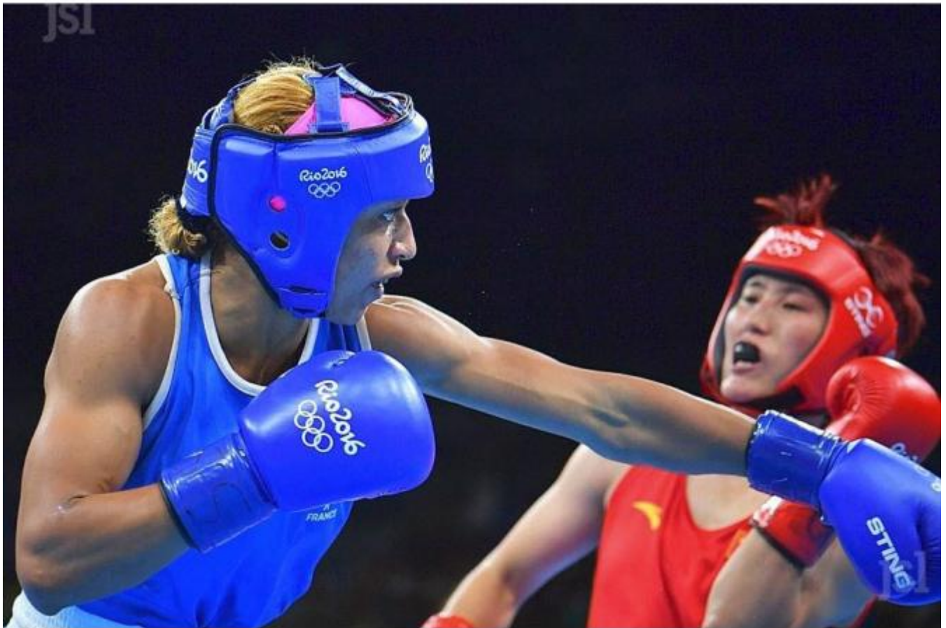
Estelle Mossely, médaille d'or aux JO de Rio, 2016