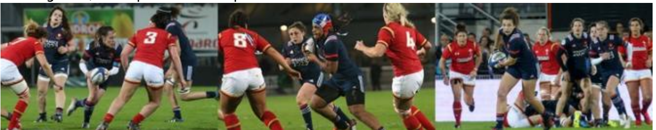
Equipe de France féminine de rugby.