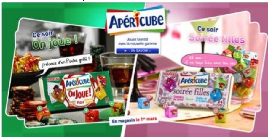
Apéricubes pour garçons et pour filles.

Dessiner sous une forme schématique la place occupée par les filles et les garçons dans la