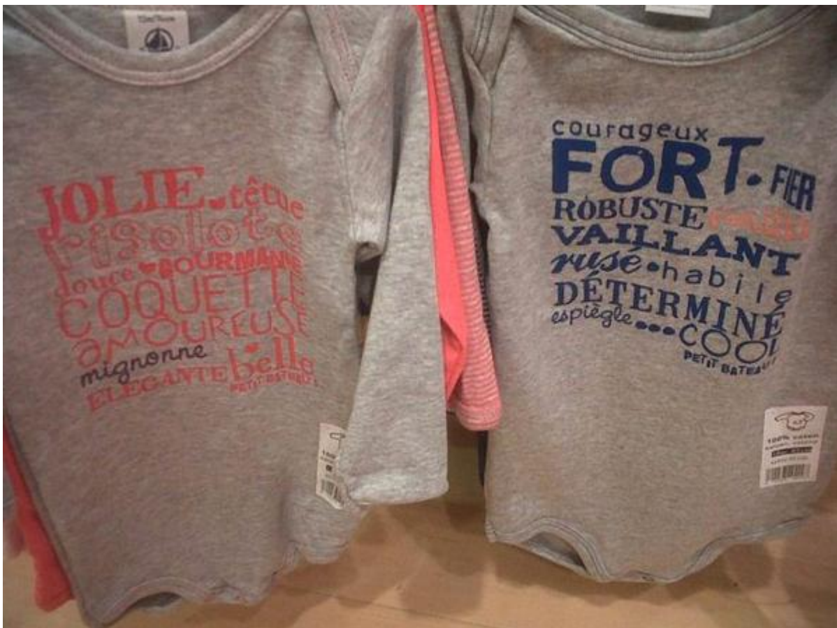
Pour les filles